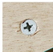
ケバ立ちなしの仕上がり。