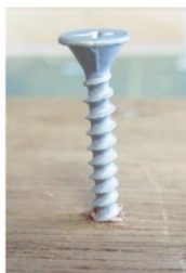
打ち込み初期のささくれ無し。