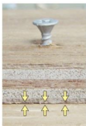
早い段階で引寄せで締まる。